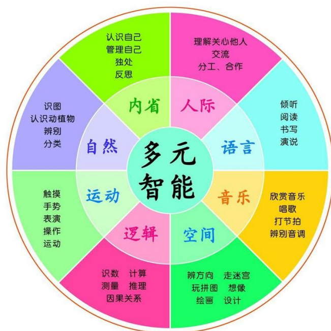
（“美好派课程”结构图）

美德课程即社会与交往课程（品德与社会类课程），包含历史学科课程群、思想品德学科课程群等。