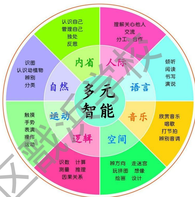
（“美好派课程”结构图）